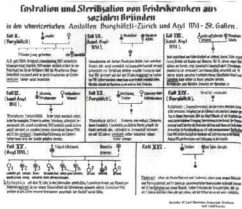
Schrifttafel an der Dresdner Hygieneausstellung 1911. S. Anm. 22 und 23.