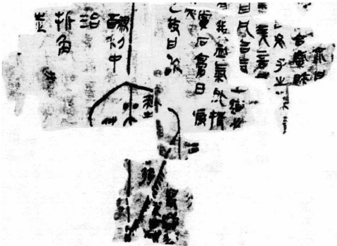
Abbildung 2: Vulva-Diagramm aus Yang Sheng Fang : Unteres Drittel des Seidenstücks.

Einige weitere Hinweise zur Deutung liessen sich aus der wahrscheinlich ältesten in China erhaltenen Linienzeichnung der Vulva gewinnen, die sich stark zerfetzt am Ende des Seidenmanuskripts Rezepturen zum Nähren des Lebens ( Yang Sheng Fang 養生方) findet (Abbildung 2). Kurioserweise markiert die Mittellinie des Körpers und der Vulva auch das Textende rechts der Mittellinie, links davon steht das Inhaltsverzeichnis. Im unteren Teil des Seidenstücks liegt dann das birnenförmige Diagramm der Vulva.